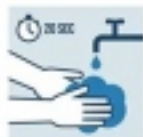
LAVAR MANOS CON AGUA Y JABÓN