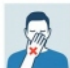
EVITAR TOCARSE OJOS, NARIZ Y BOCA CON MANOS SUCIAS