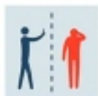
MANTENER DISTANCIA CON PERSONAS SOSPECHADAS DE INFECCIÓN