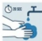
LAVAR MANOS CON AGUA Y JABÓN