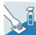
MANTENER LOS ESPACIOS Y OBJETOS LIMPIOS, VENTILADOS Y DESINFECTADOS